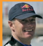
Hans-Peter Steinacher, Tornado Doppelolympiasieger