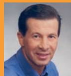
Dr. Karl Schnabl, Olympiasieger Skisprung