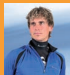
Felix Gottwald, Doppelolympiasieger